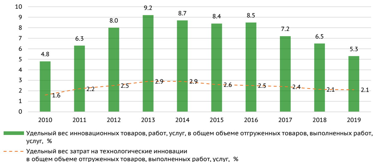
Рис. 2. Динамика инновационной активности в России / Fig. 2. Dynamics of Innovation Activity in Russia

Официальная статистика (рис. 2) показывает, что инновационная активность российского бизнеса на протяжении довольно длительного времени остается невысокой. На протяжении последних десяти лет доля инновационных товаров, работ, услуг, в общем объеме отгруженных товаров, выполненных работ, услуг, колеблется в диапазоне от 5-10%, а доля затрат на технологические инновации в общей стоимости отгруженных товаров, выполненных работ, услуг – в диапазоне 1.5-3%. Причем, начиная с 2015-2016 гг. наблюдается тенденция к снижению обоих этих показателей.