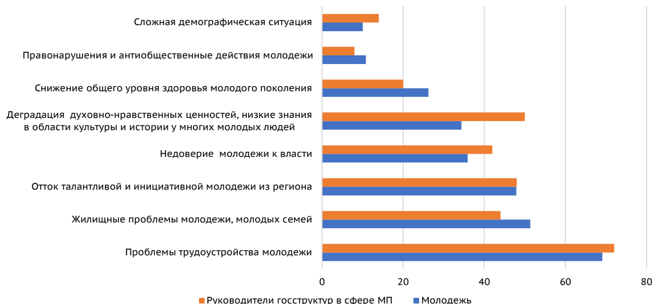
Рис. 1. Наиболее актуальные для региона проблемы, затрагивающие молодежную среду, % / Fig. 1. The Most Actual Problems of Youth in the Region, %

в сфере молодежной политики (МП) в большей степени, чем молодое поколение, уделяют внимание проблемам трудоустройства молодежи, деградации духовно-нравственных ценностей, низким знаниям в области культуры и истории, недоверия молодежи к власти и сложной демографической ситуации. Молодежь в большей степени, чем представителей государственных структур в сфере молодежной политики, волнуют жилищные проблемы.