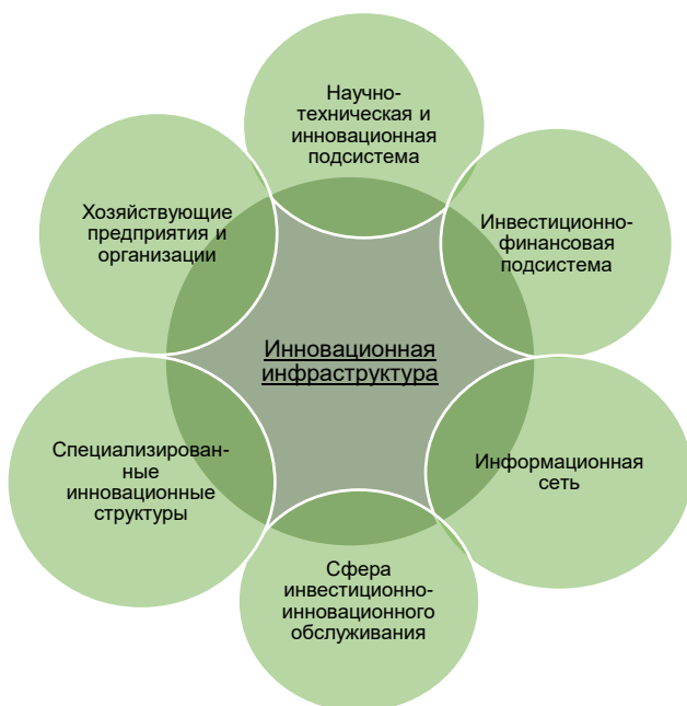
Рис. 1. Разделение инновационной инфраструктуры на подсистемы / Fig. 1. Division of innovation infrastructure into subsystems